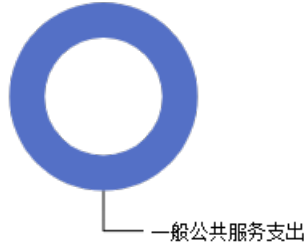
一般公共预算当年拨款结构图

2023年度一般公共预算当年拨款442.12万元,主要用于以下方面: 一般公共服务支出442.12万元,占100.00%。